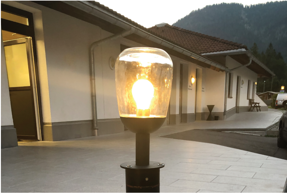
Abbildung 1.3: Direkte Blendung durch Laternen ist ein lästiges Problem für Beobachter und für jeden Spaziergänger am Abend. Versuchen Sie, diesen Lichtquellen auszuweichen.