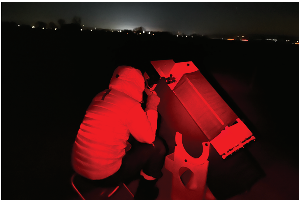
Abbildung 1.1: Nur warm eingepackt können Sie die Nacht genießen.