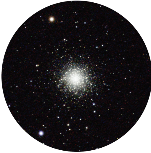
Abbildung 1.9: Der Kugelsternhaufen M 13