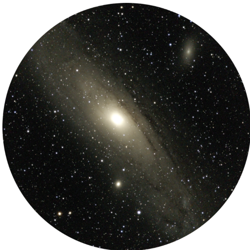
Abbildung 1.7: Die Andromedagalaxie

Sie ist die große Schwester der Milchstraße, ein zuverlässiger Begleiter und eine wahre Größenordnung im Universum. Die Andromedagalaxie (Abbildung 1.7) ist unsere nächste Nachbar-Spiralgalaxie und wird unter Astronomen kennerhaft als Objekt Messier 31 bezeichnet. Mit ihrer Nähe von nur 2,5 Millionen Lichtjahren Entfernung können wir die Spiralstruktur selbst mit kleinen Teleskopen gut erkennen.