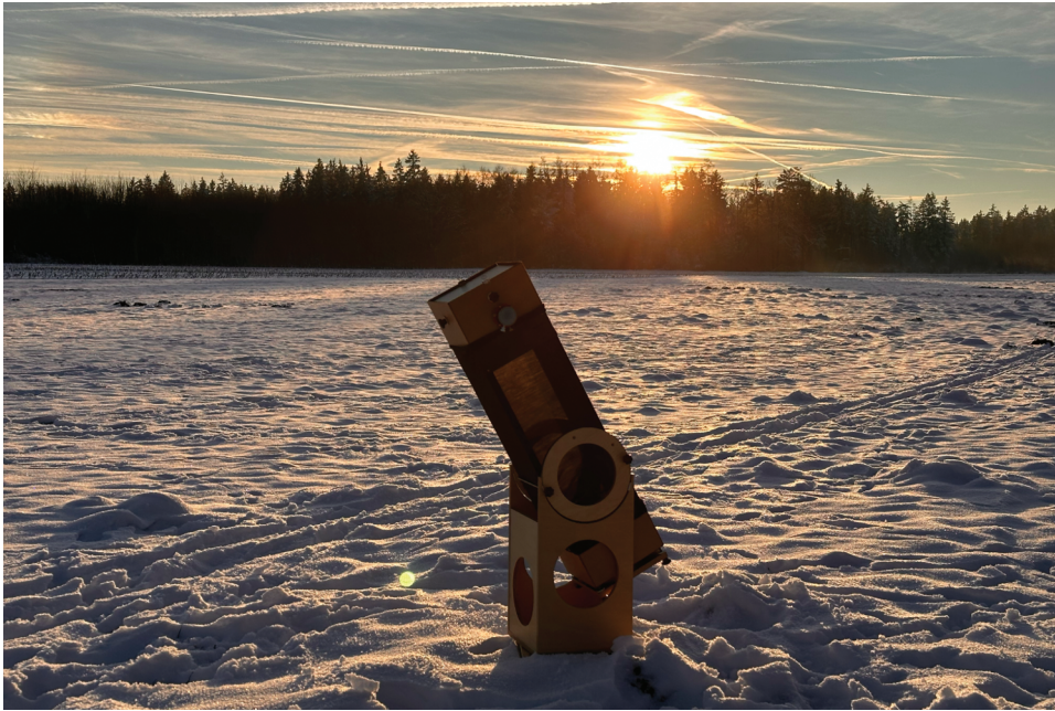
Abbildung 1.2: So kann Ihr neuer Beobachtungsplatz aussehen. Es gibt keine direkte Blendung, und Sie haben eine freie Sicht in den Himmel.