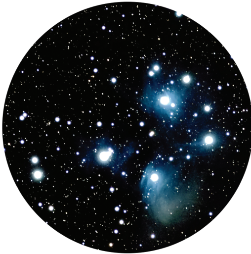
Abbildung 1.8: Die Plejaden

Die Plejaden (Abbildung 1.8), auch bekannt als das Siebengestirn oder Messier 45, gilt als der schönste offene Sternhaufen des Sternenhimmels. Wahrscheinlich konnte sie fast jeder Mensch schon einmal beobachten, wenn auch flüchtig und unbewusst. Denn im Winter stehen die Plejaden strahlend schön am Himmel. In der Mythologie stellen sie die sieben Töchter des Titanen Atlas dar.