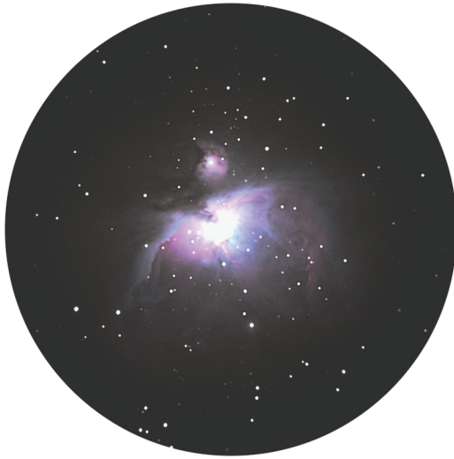
Abbildung 1.6: Der Orionnebel