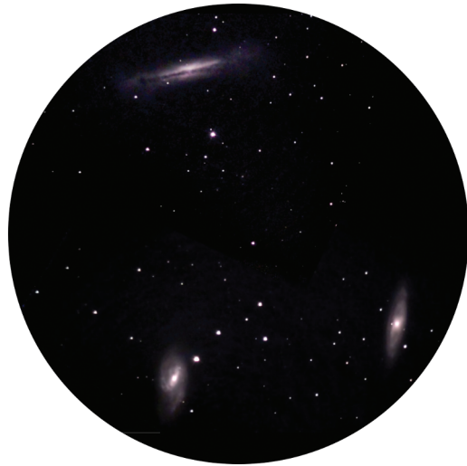
Abbildung 1.10: Das Leo-Galaxientriplet