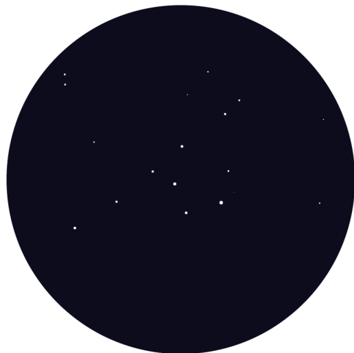
Abbildung 1.11: Der Kleiderbügel

Manche Sternansammlungen sind keine echten Sternhaufen, sondern perspektivisch zusammenhängende Sterne. Solche Objekte nennt man Asterismus. Ein besonders schönes Exemplar ist der »Kleiderbügel« CR 399 (Abbildung 1.11). Wenn Sie ihn mit einem Fernglas im Sternbild Fuchслеin aufsuchen, sieht das Sternmuster tatsächlich wie ein riesiger Kleiderbügel am Himmel aus.